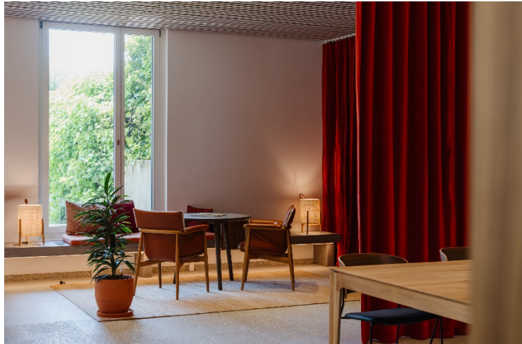
Espace de conseil rapide la BR Nyon-La Vallée à Nyon/VD (Bloomint Design et DePlanta & Associés Architectes, Genève)