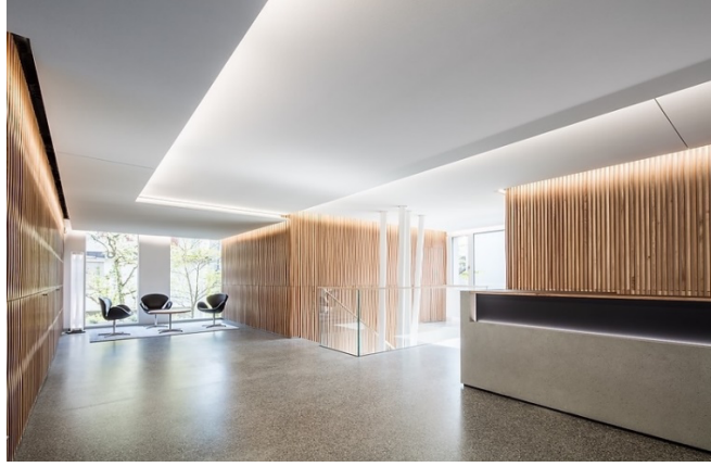
Accueil de la BR à Münsingen/BE (maeder I stooss architekten gmbh, Berne)