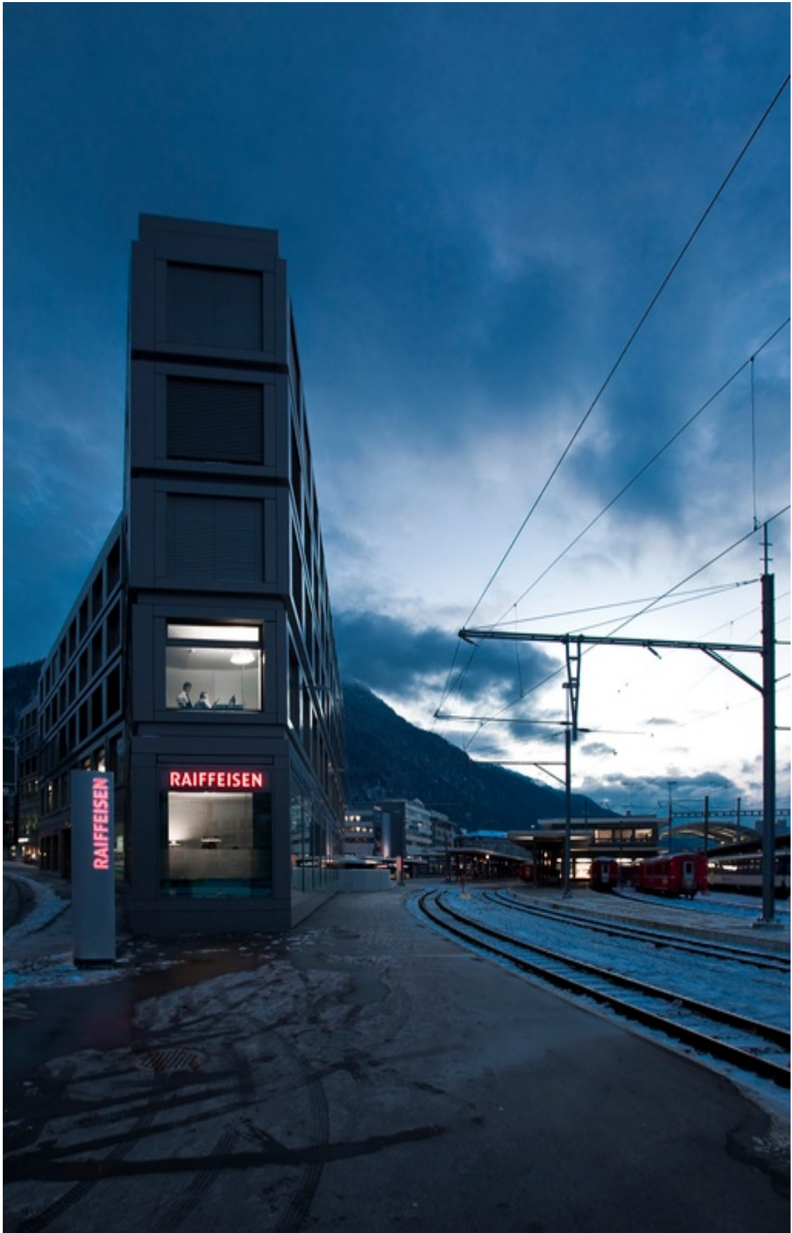
Banque Raiffeisen Bündner Rheinthal, Giubinni Architekten, Coire