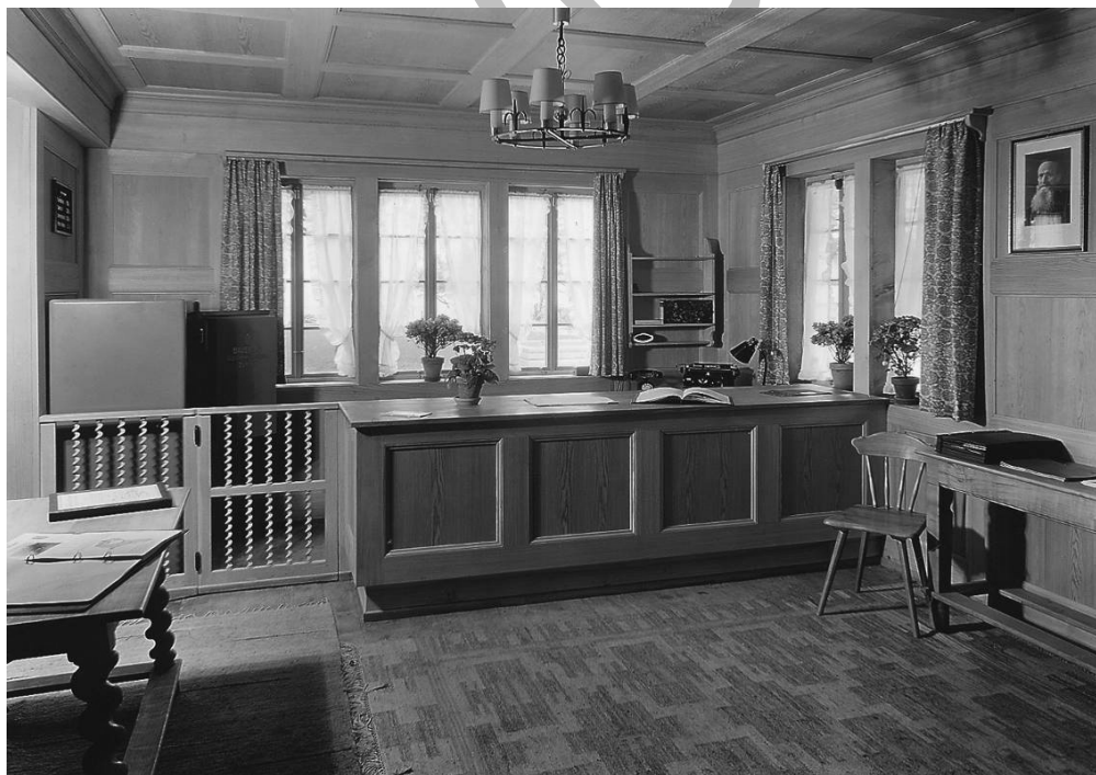
Landi 1939 – aménagement modèle pour une banque Raiffeisen

Raiffeisen ne cherche ni la maximisation des profits, ni la croissance à tout prix. Les Banques Raiffeisen poursuivent une politique de crédit prudente, contrôlent les risques et ne participent pas à la guerre des prix. Le groupe bancaire organisé en coopératives veut se démarquer par ses compétences de conseil, ses principes d'équité et de constance en matière de politique commerciale.