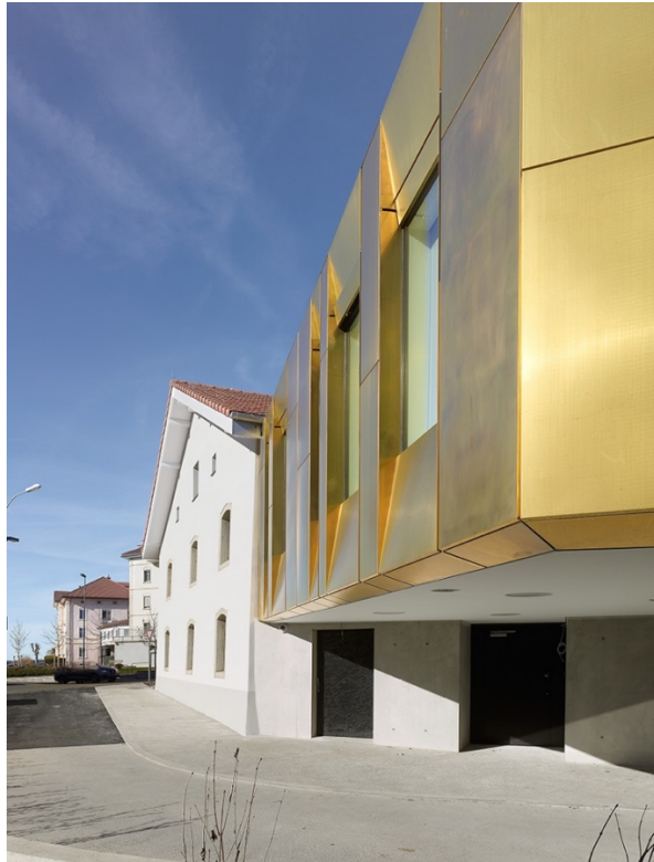
Banque Raiffeisen à Saignelégier/JU (projet ; apart architecture sa, Bienne)