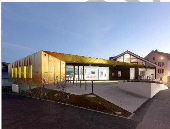
Banque Raiffeisen à Saignelégier/JU (apart architecture SA, Bienne)

Vous avez la possibilité de visiter les réalisations suivantes le ( encore à définir ) selon les horaires suivant :