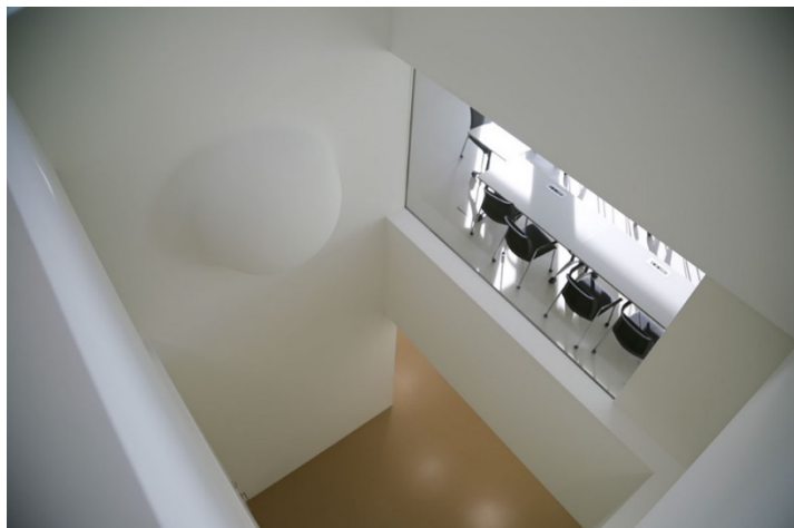
Ouverture sur plusieurs niveaux et installation d'une œuvre d'art (art et bâtiment) BR Pierre Pertuis à Sonceboz-Sombeval (Auteur du projet : Sollberger Boegli, Bienne, / œuvre d'art : Maude Schneider, Saint-Imier)

Veuillez effectuer des propositions pour le concept de signalétique de la Banque Raiffeisen.