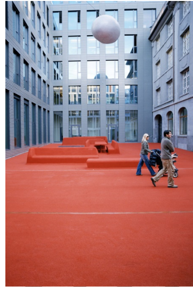
Place Raiffeisen St-Gall (Carlos Martinez/Pippilotti – Rist)